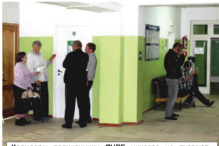
Коридоры поликлиники ЯЦРБ никогда не пустеют

Визит высоких гостей, суд со строителями, приезд новых врачей