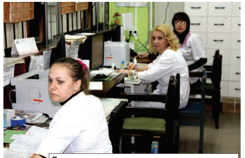
Визит к врачу начинается с регистратуры

В.Степченков. Высокие гости осмотрели нашу поликлинику, территорию больничного городка, побывали в нескольких лечебных корпусах. Мы рассказали им о том, как участвует Ярцево в национальном проекте по здравоохранению, какое оборудование в его рамках получили. Они, в свою очередь, пообщались с медицинским персоналом, посетителями поликлиники, больными, находящимися на стационарном лечении. Впечатление о нашей больнице у гостей осталось положительное.