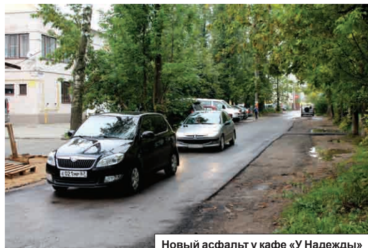
Новый асфальт у кафе «У Надежды»

И сейчас на этот участок дороги не только приятно посмотреть, но по нему одно удовольствие и пройти. Но только до медицинского центра с одной стороны и новодела магазина «Техносат», который явно не добавил солидности историческому зданию хлудовского периода, - с другой. Чем не иллюстрация к названию фильма «Там, где кончается асфальт»? А там, где кончается ас-