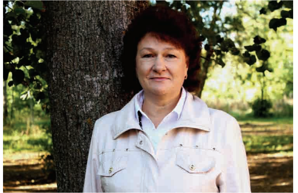
Кандидат на должность Главы муниципального образования «Михейковское сельское поселение»

Если односельчане окажут мне доверие и выберут меня депутатом, я, опираясь на приобретенные мною знания и опыт, приложу все усилия для решения возникающих в поселении проблем, и буду оказывать вновь избранному Главе поселения всестороннюю помощь в их решении.